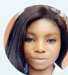
Clarice Administration Affaires