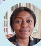
Charlène Techniques Appliquées