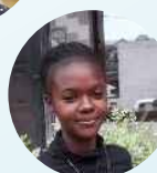
Bedeline Agro- vétérinaire